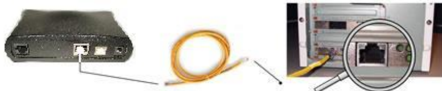
1. Conecta un extremo del cable amarillo (Ethernet) en la entrada amarilla del módem.

Importante: Te sugerimos utilizar la conexión a través del cable Ethernet por que es más sencilla de realizar ya que no requiere la instalación de controladores.